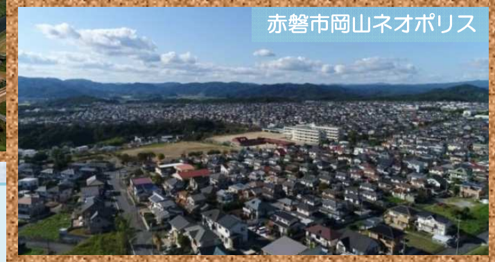
赤磐市岡山ネオポリス