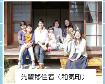
先輩移住者（和気町）

各市町の移住者支援団体や先輩移住者の方とざっくばらんにお話いただけます！ 知りたいこと、気になること、不安に思っていること、何でも遠慮なくお尋ねください。